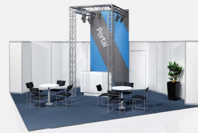
PORTAL ab 105,90 €/m 2 online konfigurierbar