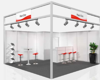
MAXI ONE ab 56,00 €/m 2 online konfigurierbar