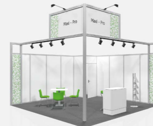
MAXI PRO ab 78,20 €/m 2 online konfigurierbar