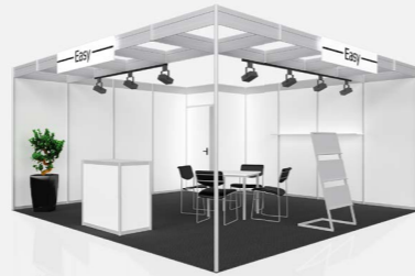
EASY ab 52,00 €/m 2 online konfigurierbar

Diese und über 100 weitere Standtypen können Sie online konfigurieren und direkt bestellen.