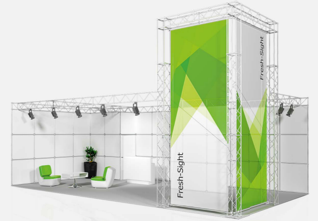
FRESH SIGHT ab 108,40 €/m 2 online konfigurierbar