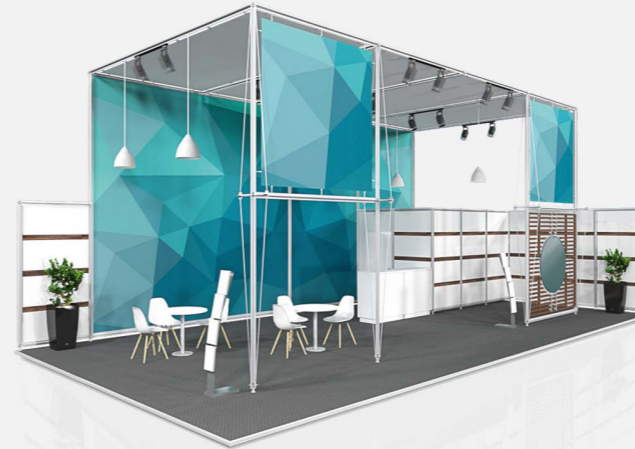
ALPHA ab 259,00 €/m 2 online konfigurierbar